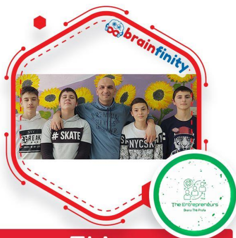
Екипа The Entrepreneurs